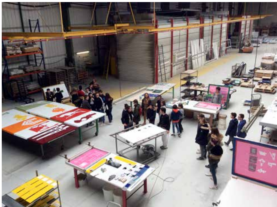
Visite des participants des ateliers à l'usine de Bretagne Émaillage à Heric pour observer comment on fabrique des panneaux en acier émaillé