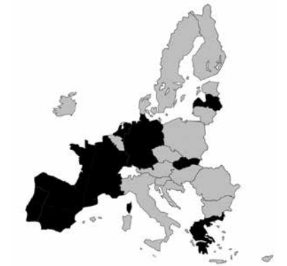
Les pays européens représentés sont en noir