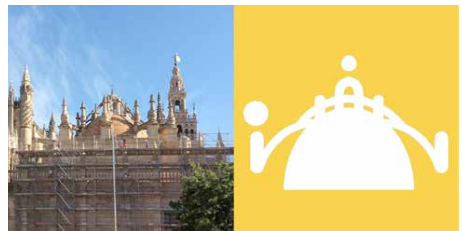
Les sources des pictogrammes des panneaux dans le hall d'entrée