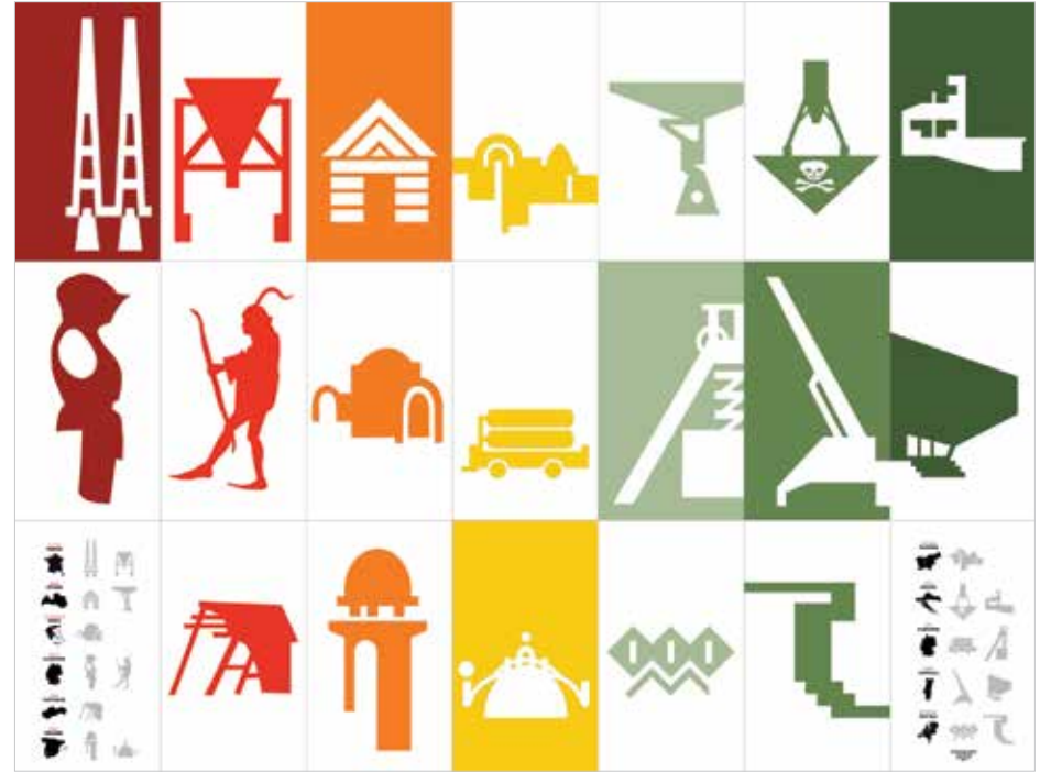
Les 21 panneaux du hall d'entrée