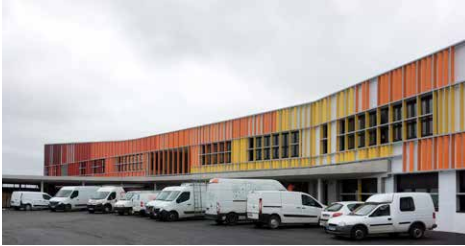
Le nouveau collège la veille de la remise des clefs