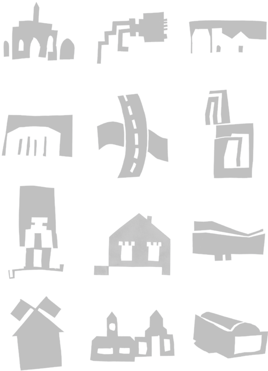
Quelques pictogrammes réalisés lors des ateliers